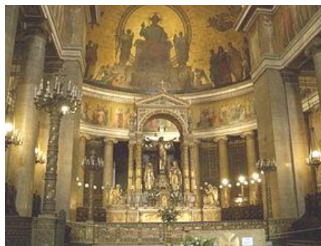
une belle église parisienne

Eglise St-Vincent de Paul place Franz Liszt (rue Lafayette) 75010 PARIS métro : Poissonnière, ou gare du Nord