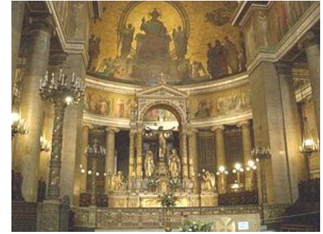
une belle église parisienne