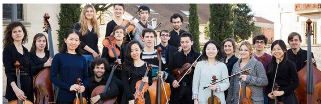
L'ensemble Les Illuminations